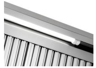
► Dunstabzugshaube mit 2 Filtern